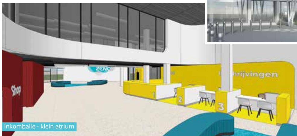
Inkombalie - klein atrium